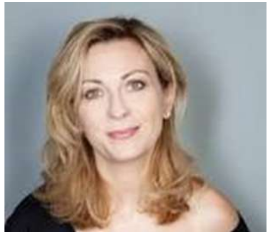
Natalie Dessay (Emma Calvé)