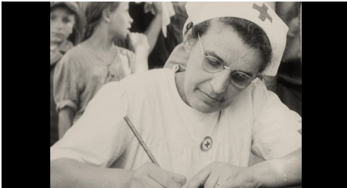
Arhivski kadar Diane Budisavljević iz filma "Dnevnik Diane Budisavljević"

SAŽETAK: Uručak donosi prijedlog metodičke obrade nastavne jedinice o razdoblju Drugog svjetskog rata u Hrvatskoj, koja prati prikazivanje filma "Dnevnik Diane Budisavljević" u srednjoj školi. Tekst je namijenjen nastavnicima povijesti u srednjim školama i gimnazijama, a u prilagođenom obliku mogu ga koristiti i nastavnici drugih predmeta.