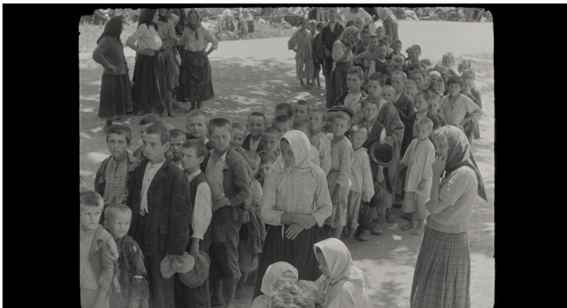
Djeca u redu za popisivanje u logoru Stara Gradiška koji je bio u sastavu Jasenovca